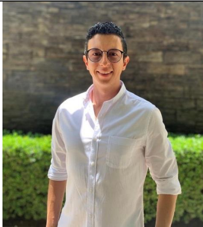
SOBRE VICTOR TARAZONA

Reserva tu cupo escribiendo al WhatsApp (+57) 312-3514148.